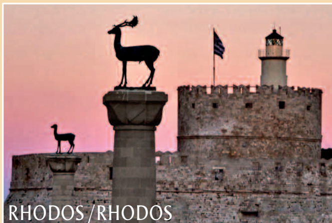
RHODOS / RHODOS

– Insel göttlicher Geschichten und Mythen –