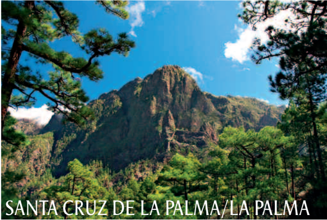
SANTA CRUZ DE LA PALMA/LA PALMA