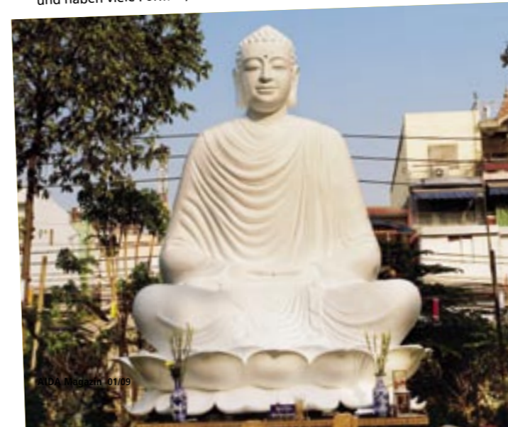
Buddhastatuen sind in Asien allgegenwärtig und haben viele Formen, Farben und Gesichter.