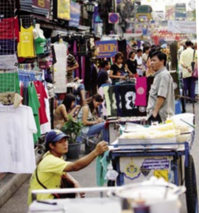
Ein Spaziergang durch die Khao San Road gleicht einer Sinnesreise durch unzählige Welten, bei der man sich wünscht, nie anzukommen, so betörend und verwirrend ist sie.