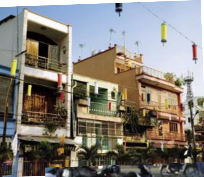
Bunte Wimpel und Girlanden schmücken die Straßen während der Feierlichkeiten zum vietnamesischen Neujahrsfest.

der Luft. Am Rande des Cong-Vien-Van-Hoa-Parks warteten Fahrradfahrer unter Bäumen aus roten Luftballons und warfen Blicke herüber, die sowohl schadenfroh als auch bemitleidend wirkten. Nur an der Kathedrale Notre Dame, die die Franzosen während der Kolonialzeit errichtet hatten, standen ein paar Touristen und fotografierten. Im Gegensatz zu dem britischen Einfluss in Singapur ist in Vietnam noch immer die französische Kolonialzeit zu spüren. Und im Gegensatz zu beiden merkt man in Bangkok, dass sich dort nie eine europäische Macht breitgemacht hat. Auch geschichtlich sind diese drei Städte »Same same but different«.