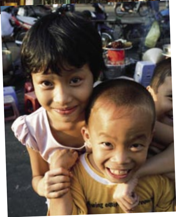
Vor dem Ben-Than-Markt im Zentrum von Ho Chi Minh Stadt herrscht zu jeder Uhrzeit ein chaotisches Gewimmel. Außerhalb der Metropole hat Vietnam ein anderes Gesicht: Zwei Drittel der Bevölkerung arbeiten noch immer auf den Reisfeldern.

Vom 26. Oktober 2009 bis 12. April 2010 ist AIDAcara in Südostasien unterwegs. Weitere Informationen, Reiseternine und Preise zu den Reiserouten von AIDAcara finden Sie im Katalog »AIDAtime März 2009 bis Mai 2010« oder auf www.aida.de .