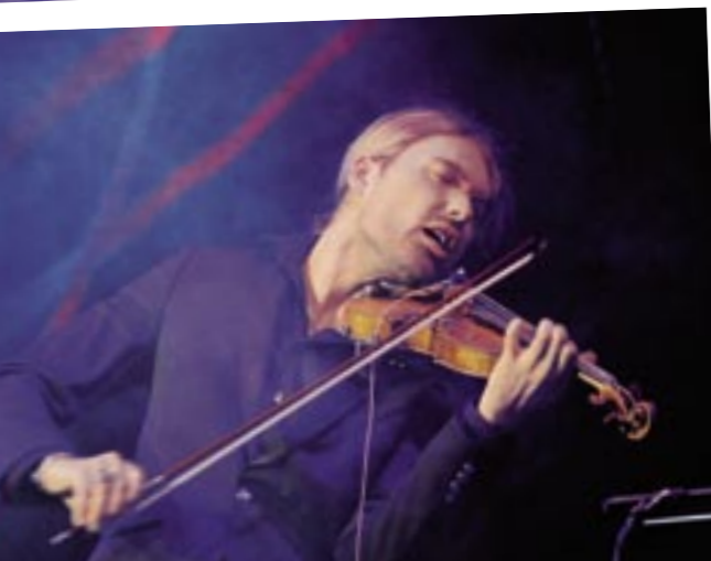
Der deutsch-amerikanische Starviolinist David Garrett bezauberte mit Musik und Sexappeal. Seit einem Jahr steht er als schnellster Geiger der Welt im Guinness-Buch der Rekorde.