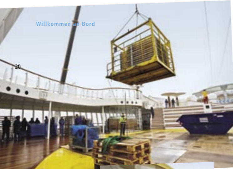
Gute Laune trotz Regen: Das Bar Team der Pool Bar verteilt die Sonnenmöbel auf den Decks 11 und 12.