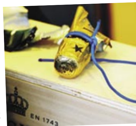
Der abgeschlagene Hals der Champagnerflasche wird gerahmt und in der Kapitänskammer aufgehängt – als Glücksbringer.